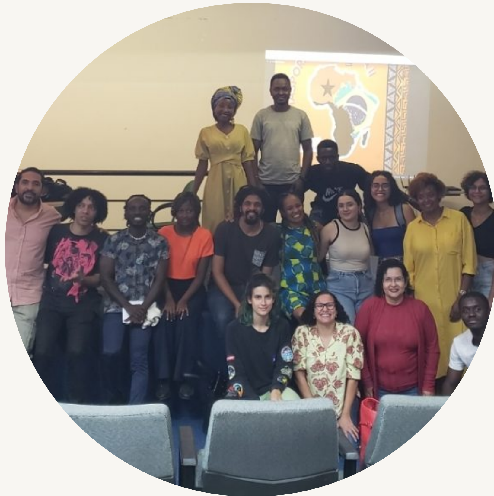
A Diáspora se encontra II